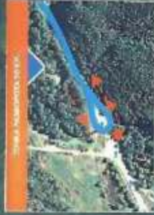
Зона лыжных трек