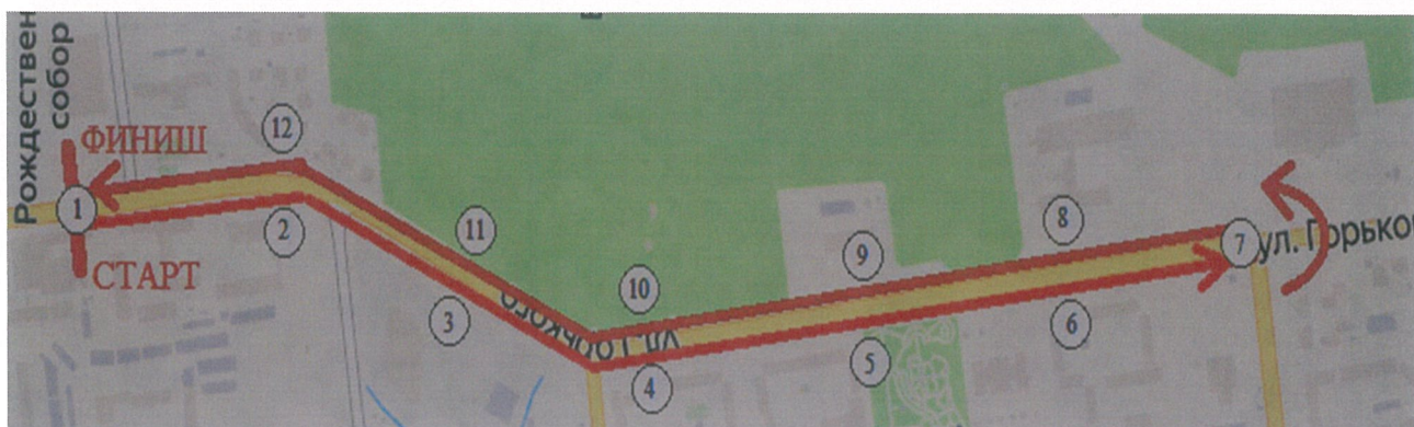
Схема маршрута легкоатлетической эстафеты по улицам города Южно-Сахалинска